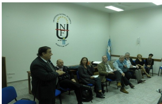
Sesiones de trabajo con áreas de la Universidad

Para finalizar el encuentro, se subrayó que a partir de la concreción de esta evaluación externa y luego de que la CONEAU confeccione el correspondiente informe, la UNaF podrá llevar adelante proyectos de mejora institucional y solicitar financiamiento para el desarrollo de diversas iniciativas, con miras a la elaboración del Plan Estratégico de Desarrollo Institucional de la Universidad, el cual fue oportunamente anunciado por la máxima autoridad de la institución.